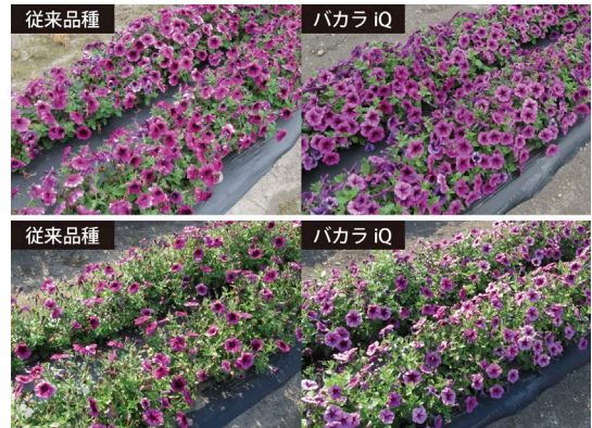
従来品種と「バカラ iQ」の降雨前後の比較 上：降雨前日 (5/30)、下：降雨2日後 (6/2) 2018年 掛川総合研究センター

また、同シリーズはタネから生産する実生系品種であり、挿し木などで生産する栄養系品種と比べて一般的に1ポット当たりのコストを抑えられます。従来雨に比較的強いペチュニアには栄養系品種が多く、多数の株を使う現場ではコスト面が課題となっていました。同シリーズは雨の強さなど性質面、実生系であることのコスト面、2つのメリットを兼ね備えた品種です。