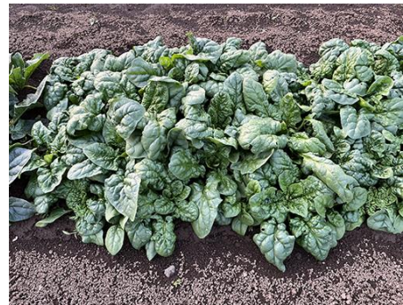
他社品種：ちぢみホウレンソウ

『寒締め吾郎丸』は葉枚数を増やし収量性を改善しました。荷姿には西洋種に見劣りしないボリューム感があります。葉軸がしっかりしていて、立性で茎が柔軟で折れにくく、収穫作業性も優れています。