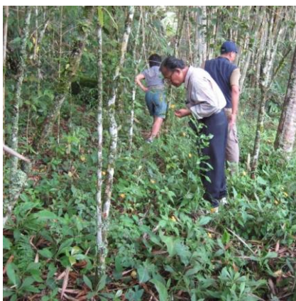
インドネシアでの遺伝資源の共同探索・評価の様子

当社がインドネシア政府と共同で探索した遺伝資源を活用して開発した「サンパチェンス」は、統一ブランド名でグローバルで販売しており、高く評価されています。全世界での累計販売数は7億株を超えており、今年で発売20周年を迎えます。