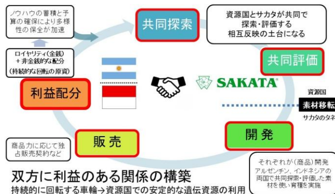
サカタのタネの遺伝資源開発モデル

当社は、インドネシアおよびアルゼンチンと共同で遺伝資源の探索・評価を行い、双方に利益のある関係を構築しています。